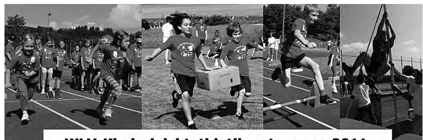
WLV-Kinderleichtathletik unterwegs 2011