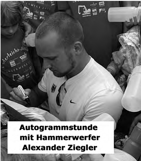
Autogrammstunde mit Hammerwerfer Alexander Ziegler