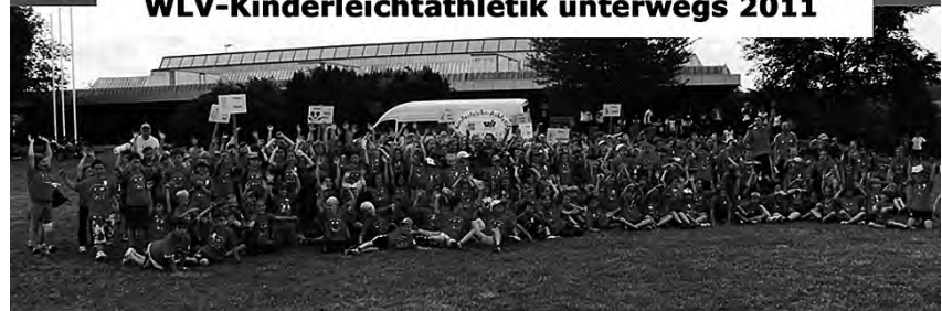
»Spiel, Spaß und Action für 300 Kinder der Hillerschule Steinheim.«