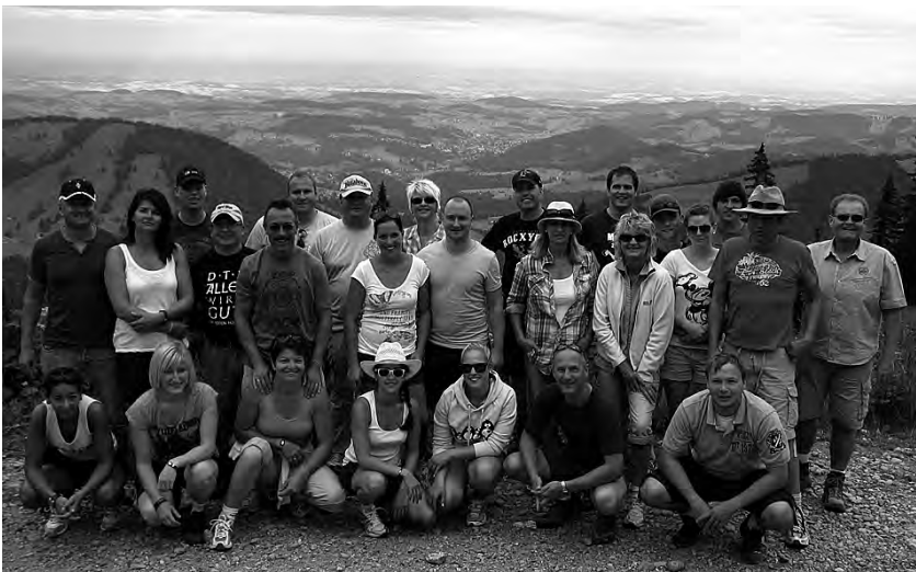
Handball-Ausflugsgruppe vor dem Staufner Haus

Viel Spaß hatten die über 40 teilnehmenden Mädels und Jungs der TV-Handballabteilung beim zweitägigen Trainingscamp am letzten Oktober-Wochenende. Zu Beginn der Herbstferien veranstalteten die Steinheimer Handballer ihr schon traditionelles Trainingscamp für ihre E-, D- und C-Jugendteams. Am Samstagmorgen ging es nach der Begrüßung und einem gemeinsamen Fototermin gleich mit einigen Aufwärmspielen los. Anschließend wurde an fünf verschiedenen Stationen die Koordinationsfähigkeit aller teilnehmenden Kids geschult und geför-