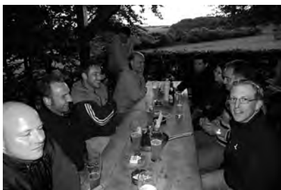
Die AH'ler in Aktion