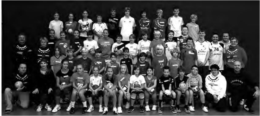
Gruppenfoto beim Jugend-Trainingscamp der TV-Handballabteilung - die jungen Sportler erlebten mit ihrem Betreuersteam zwei abwechslungsreiche Tage auf und abseits des Spielfeldes.

nen recht viel Spaß gemacht hat. Herzlichen Dank noch einmal an alle, die zum guten Gelingen dieses Trainingscamps 2011 beigetragen haben, egal ob »vor oder hinter den Kulissen« - wir freuen uns schon auf das nächste Mal!