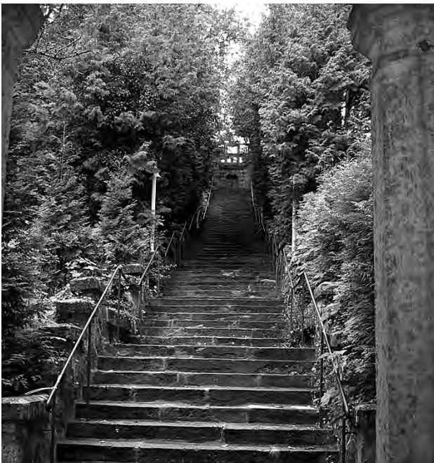
Das tägliche Fitnessprogramm