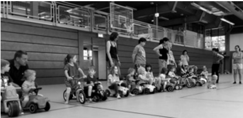
Viel Los in der Wentalhalle während der Übungsstunde

Zum Ende der Turnstunde singen wir unser Abschiedslied. Vorweg, wenn noch Zeit übrig ist, beenden wir unseren »Bewegungsdrang« mit einem Fingerspiel, einem Lied, einer Geschichte, einer Massage zum Entspannen und ruhig werden. - lasst euch überraschen! Neben all ihren Körper- und Gruppenerfahrungen sind die Kinder mit all ihren Sinnen aktiv im Turn- und Spielgeschehen eingebunden. - Die Freude an Bewegung, sich spielerisch frei und ungezwungen bewegen zu können, wirken sich auch positiv auf das Gemeinschaftsgefühl aus. Aber auch die sozialen Strukturen des Sports in Form von Regeln, Normen, Werten und Rollen für das sportliche Handeln sind von wichtiger Bedeutung.