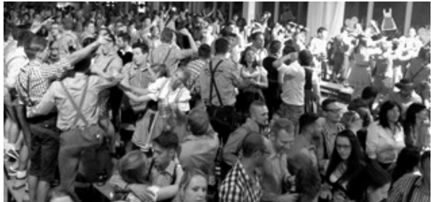
Beste Stimmung herrschte auch in diesem Jahr