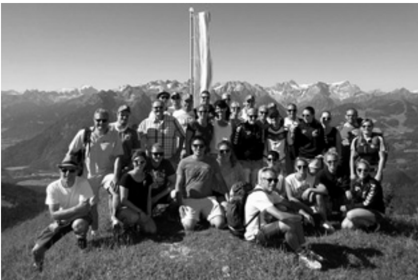
Die Ausflugs Teilnehmer auf dem Hochplateau vor der »Frassenhütte«