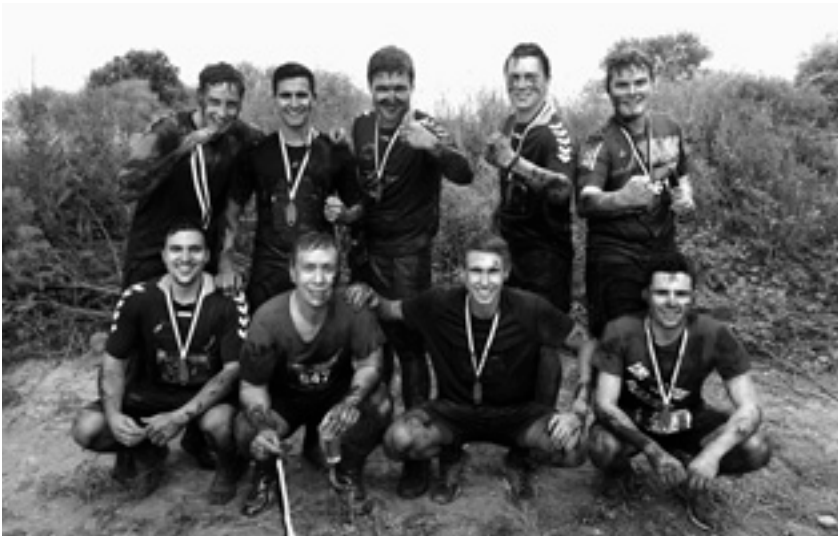
Zehn Kilometer Matsch, Wasser und knifflige Hindernisse bei »Rats-Run 2016« in Augsburg - strahlende Gesichter bei den Teilnehmern der TV-Handballer.