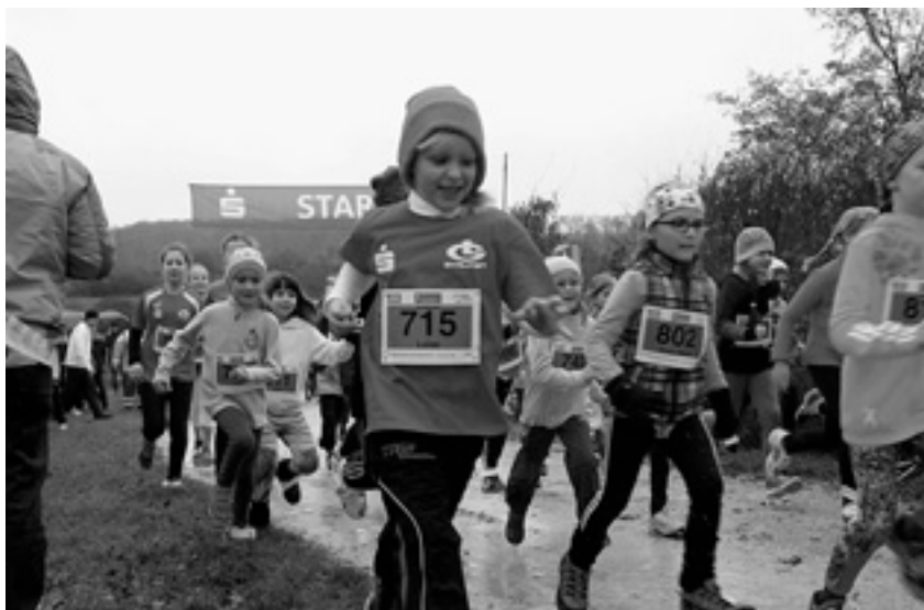
Die Kleinsten sind immer mit großen Engagement dabei