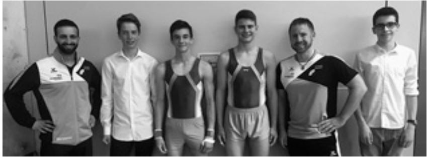
Die Jungs vom Albuch

Am 04. Juni 2016 fanden die Gaumehrkampfmeisterschaften sowie der Kindercup der Fachgebiete in Bö-