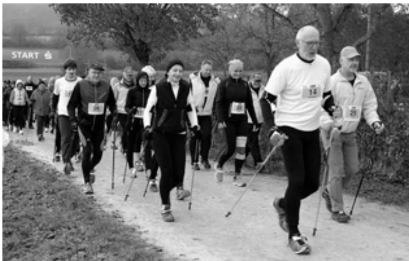
Die Walker sind ein fester Bestandteil des Geologenlaufs