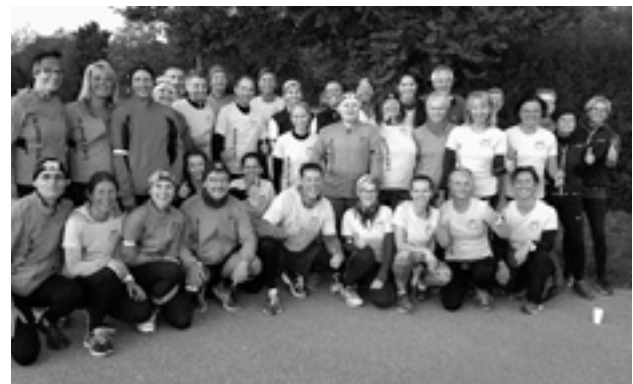
Insgesamt unterstützten 15 Abteilungsmitglieder die »Neuen« bei Lauf geht's

Das Laufjahr endet traditionell beim eigenen Geologenlauf, dem Nikolaus in Schnaitheim und dem Silvesterlauf in Mergelstetten.