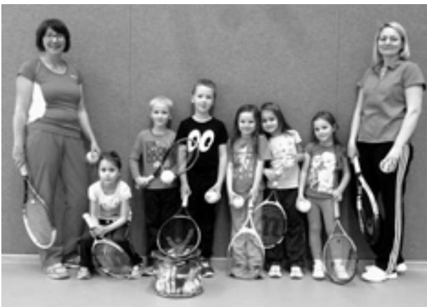
Unser Tennism Nachwuchs hat bereits viel Spaß beim Trainieren