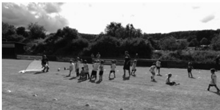
Mit viel Begeisterung waren die Kids am Bambinispieltag dabei

Es gab in der zweiten Jahreshälfte also viel Licht und Schatten. Positiv waren auf jeden Fall Vielzahl der hinzugekommenen Spieler sowie die Bereitschaft sich aktiv zu verbessern. Leider waren die Ergebnisse nicht so erfolgreich. Dennoch können die Abteilung und der Verein positiv in die Zukunft sehen, denn mit den Kindern wird sehr gut gearbeitet und Fortschritte sind deutlich zu erkennen, auch in den Ergebnissen. Während anfangs die Niederlagen sehr deutlich ausfielen, konnten im Laufe der Hinrunde Punkte gesammelt werden und die Niederlagen fielen auch gegen uns überlegene Gegner nicht mehr hoch aus. Von der Hallenmeisterschaft und der Rückrunde erhoffe ich mir als Jugendleiter der Fußballabteilung folglich sehr viel.