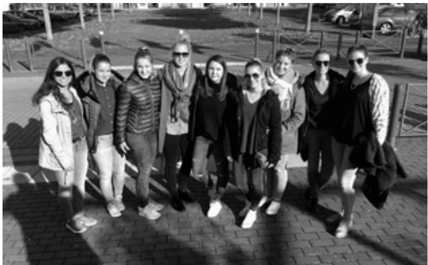
Unvergessliche Tage in Colombelles - Steinheims Handballerinnen waren mit dabei!